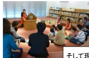
そして現在の図書館でも!